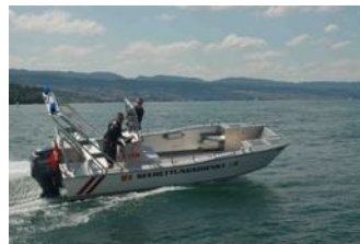
Ballei (ZH 46)

Rufname: Wädenswil 1 Targa 32 (Professional) Länge: 10.78, Breite: 3.37 Gewicht: ca. 7'000 kg Leistung: 2 x 330 PS