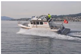
Johanniter IV (ZH 4)

Rufname: Wädenswil 1 Targa 32 (Professional) Länge: 10.78, Breite: 3.37 Gewicht: ca. 7'000 kg Leistung: 2 x 330 PS